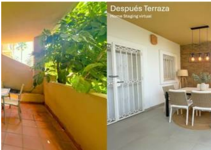
Después Terraza Home Staging virtual