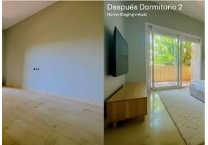
Después Dormitorio 2 Home Staging virtual