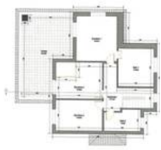
VIVIENDA P. ALTA 120.00 m 2 (1300.00 ft 2 )