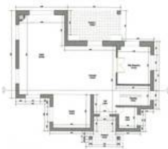
VIVIENDA P. BAJA 120.00 m 2 (1300.00 ft 2 ) 120.00 m 2 (1300.00 ft 2 ) 120.00 m 2 (1300.00 ft 2 )