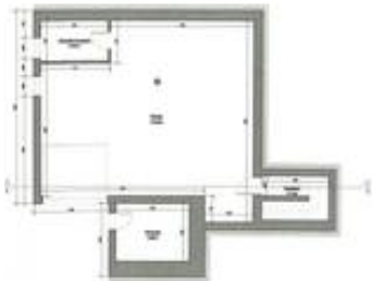
VIVIENDA P. SOTANO 120.00 m 2 (1300.00 ft 2 )