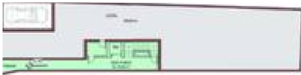
PLANTA 1-2 y 3