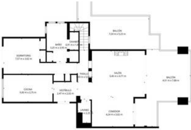
TOTAL: 186 m 2 Planta Baja: 186 m 2 , 17' piso: 54 m 2 Área del Pórtico: 84,70 m 2 - Múltiplo: 16 m 2