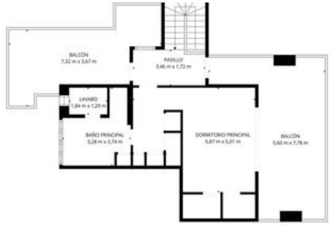
TOTAL: 186 m 2 Planta Baja: 186 m 2 , 17' piso: 54 m 2 Área del Pórtico: 84,70 m 2 - Múltiplo: 16 m 2