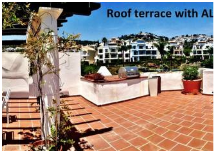
View to pool 3 & 4 from rear terrace